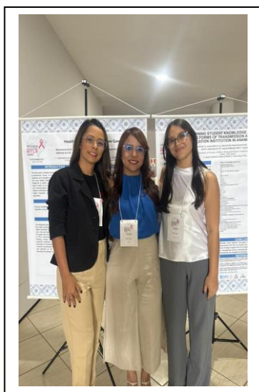
Participação em Evento Internacional

Apresentação de relatório final de Iniciação Científica 2024-2025(em anexo)