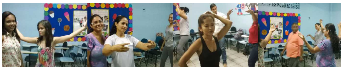
Figura 03: Oficina de Teatro de sombras (preparação com jogos lúdicos)