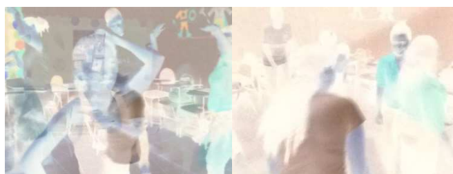
Figura 04: Oficina de Teatro de sombras (preparação das cenas)