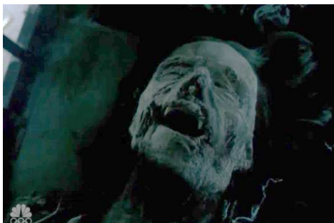
Imagem 01 - Primeiro episódio, The blood is the life