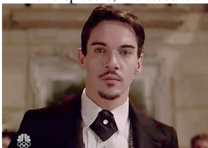
Imagem 02 - Primeiro episódio, The blood is the life