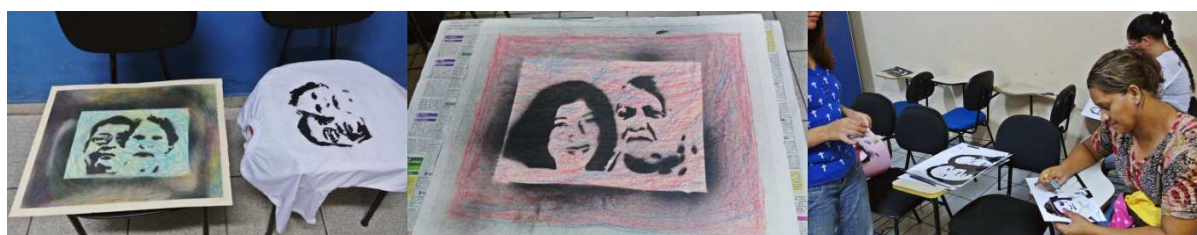
Figura 01: Oficina de Fotomontagem (com café, materiais expressivos; e gravura e estamparia)