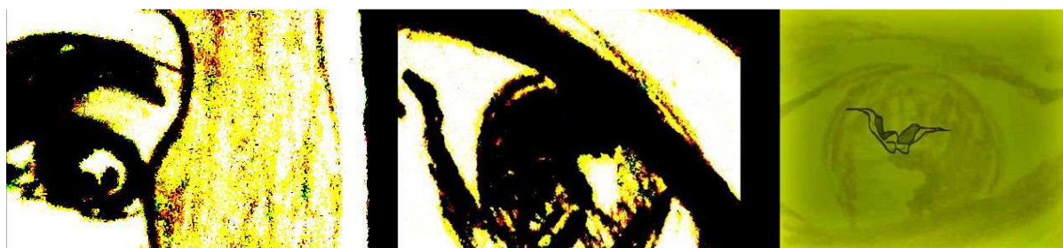
Figura 02: Oficina de Fotomontagem (frame do vídeo-animação “Olha...Jully”)